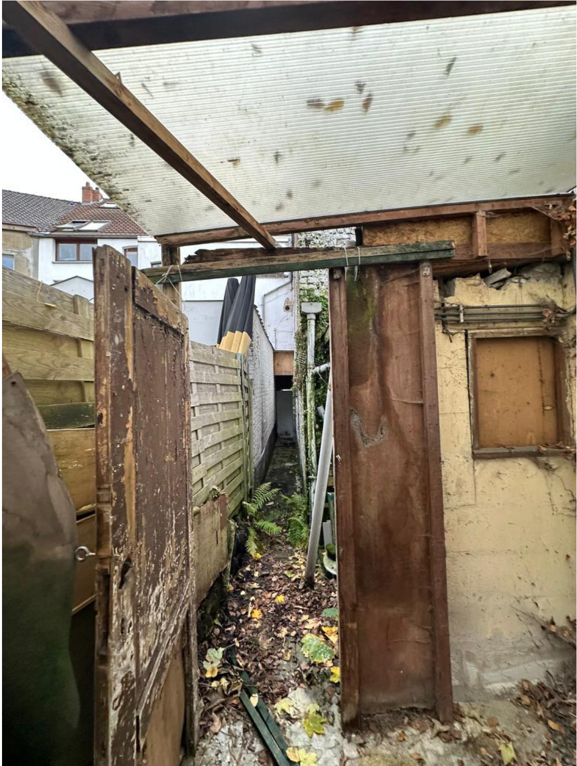
Vue 07 - Annexe en façade arrière